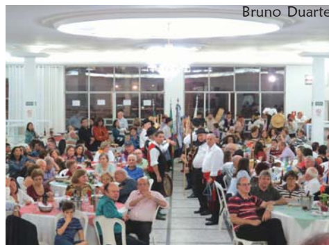
O público compareceu em um bom número, onde pôde conferir, a apresentação do R.F. Verde Gaio