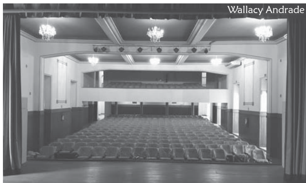
Tudo está pronto para a inauguração do teatro. A cidade ganhará mais uma opção, para suas apresentações cênicas e musicais