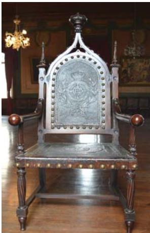
Poltrona com assento e encosto em couro da sede cultural

Uma das particularidades mais notórias e relevantes do Centro Cultural Português é o conjunto ornamental que compõe o edifício e, em especial, o Salão Camoniano. Junto da riqueza de suas pinturas murais e do forro paramentado com passagens de "Os Lusíadas", há que se fazer menção à magnificência do seu centenário mobiliário.