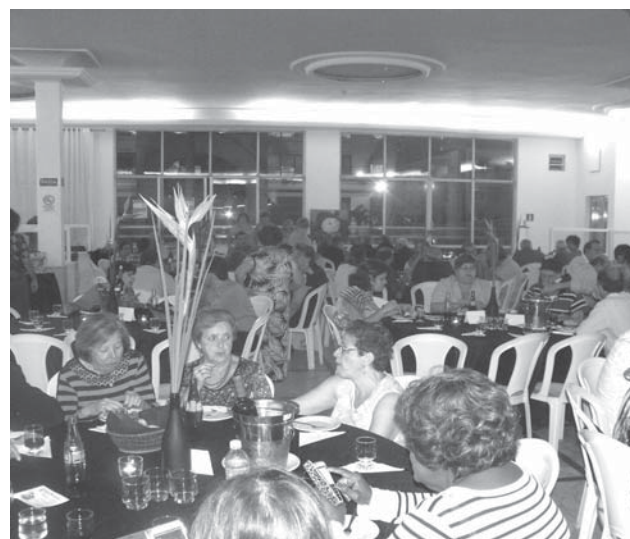
Uma noite em prol da assistência aos idosos do Rosmaninho

Dia 02 de outubro aconteceu mais um evento do Grupo Rosmaninho em prol de suas atividades de assistência ao idoso. Foi a festa "Queijos e Vinhos em Noite de Primavera", que encheu o salão social do Centro Cultural Português de amigos que se encontraram para conversar, se deliciar com queijos, frios e vinhos, e dançar animadamente ao som do Johnny (da Johnny Brazilian Band).