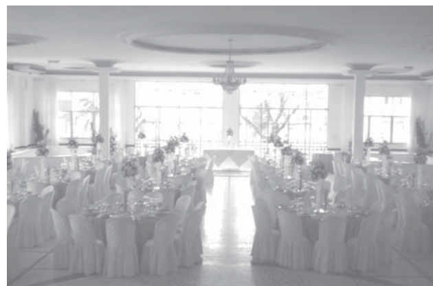
Salão social do Centro Cultural Português, já decorado

Para mais informações e reservas, ligue para 3234-9395.